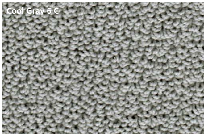
Cool Gray 6 C