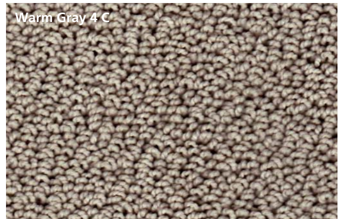
Warm Gray 4 C